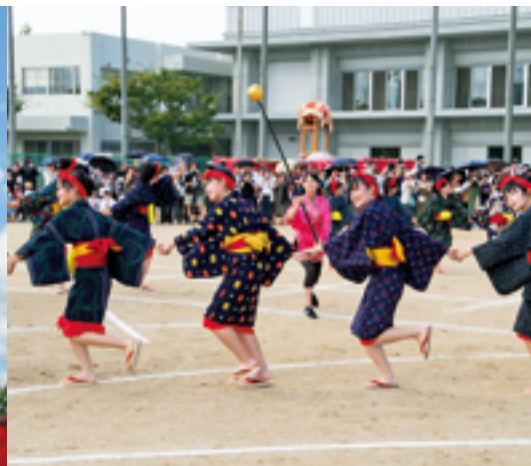
伝統のデカンショ／民謡踊り 第71回観一祭にて（令和元年9月7日）