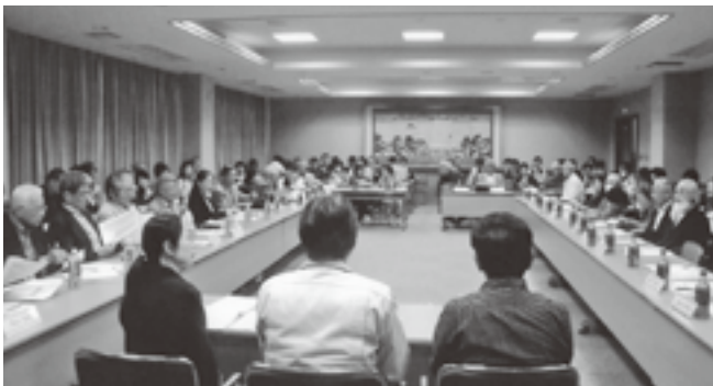
幹事会 2019年4月27日 観一同窓会本部の幹事会・理事会を母校観音寺一高内の 百周年記念館で開催しています。